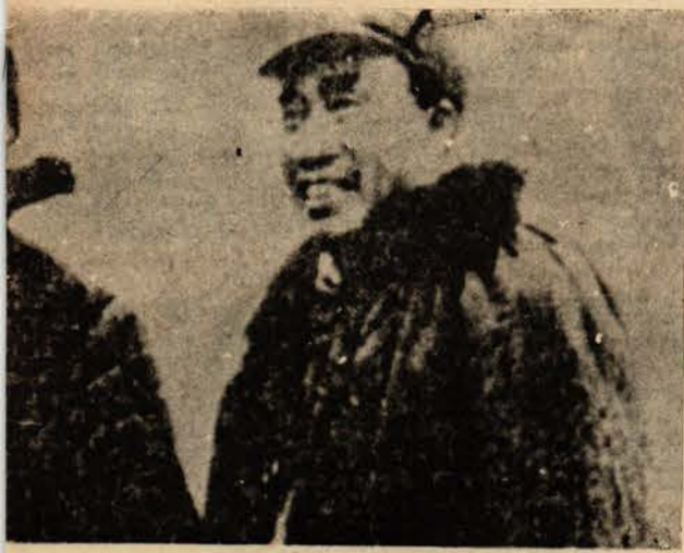
Çu Teh, 1936'da Uzun Yürüyüş sırasında

niğiye uğratmasından sonra toplanan Cenevre Konferansında, Çin heyetine başkanlık etti. Konferansta O. zamanın astığı astık kestiği kestik ABD Dışişleri Bakanı John Foster Dulles'a karşı dişediş bir mücadele verdi. Bir yıl sonra, üçüncü dünyanın doğuşunun ilk adımı olan 1955 Bandung Konferansı toplandı. Bu konferansta da Çin heyetine başkanlık eden Çu En-lay'ın sunduğu barış içinde bir arada yaşamın beş ilkesi, konferans tarafından kabul edildi ve gitgide güçlenerek bugüne geldi.