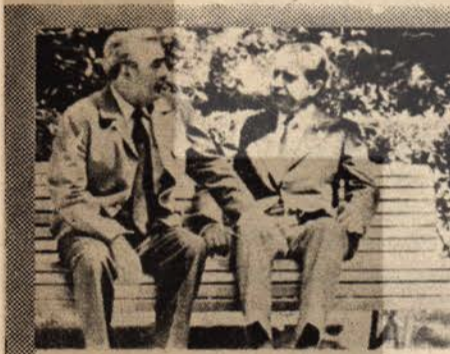
Brejnev ve Nikson...