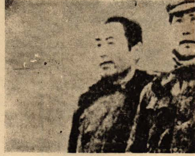
Soldan itibaren, Çu En-lay, Mao Zedung

Şangay'dan kaçan Çu En-lay, ilkönce Vuhan'a, oradan da, Nançang'a gitti. Nançang'da, ünlü 1 Ağustos ayaklanmasının hazırlanmasına katıldı. Bu ayaklanma, daha sonra Mao Zedung'un yönettiği Çüz Hasadı Ayaklanmasıyla birleşerek, Çinkang