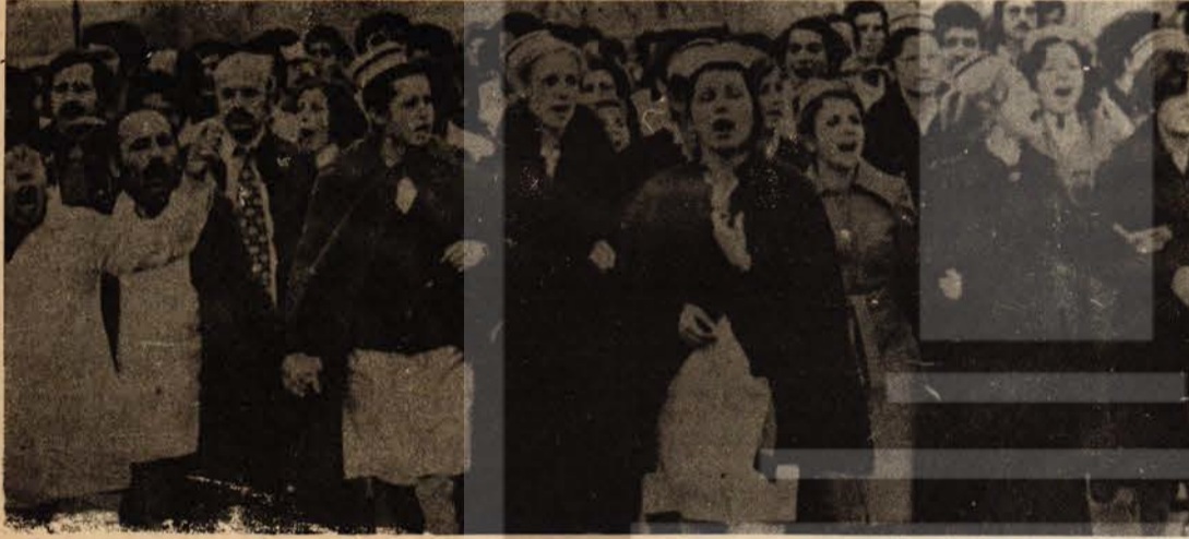
Hacettepe doktor, hemşire ve personeli yürüyor: "KATİL İKTİDAR"

eden öğrencilere polis saldırı. Yaralanan iki öğrenci gözaltına alındı. 8 Ocak'ta İstanbul Teknik Üniversitesi'ne bağlı bütün fakültelerde boykota gidildi. İTÜ öğrencileri Taşkışla binasında toplandılar ve gösteri yaptılar. 9 Ocak'ta Hacettepe Üniversitesindeki polis saldırısını protesto eden öğrencilere polis Amerikan Konsolosluğu önünde ateş açtı. Maçka'da iki gencin yaralanmasını ve faşist saldırılarını protesto eden öğrenciler, 12 Ocak günü Maçka Maden Fakültesi'ni işgal ettiler. Öğrenciler, sabaha kadar iki süper devlete, faşizme ve revizyonizme karşı mücadelenin meselelerini tartıştılar. 13 Ocak sabahı Maçka'dan Taksim'e kadar bir yürüyüş yapıldı. Taksim'de yapılan