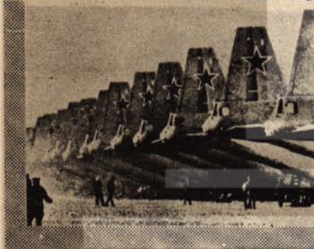
Sovyet savaş uçakları...

— Deng Siao-ping, Nisan 1974 (Birleşmiş Milletler Altıncı Olağanüstü Genel Kurulunda Konuşma)