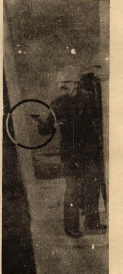
Yurtseverlere kurşun sıkan bir toplum polisi

konuşmada gençliğin faşizme karşı mücadeleyi baltalayan unsurları içinden atarak birliğini sağlaması gerektiği belirtildi. Öğrenciler, emperyalizme, sosyal-emperyalizme ve faşizme karşı mücadele andı içerek dağıldılar.